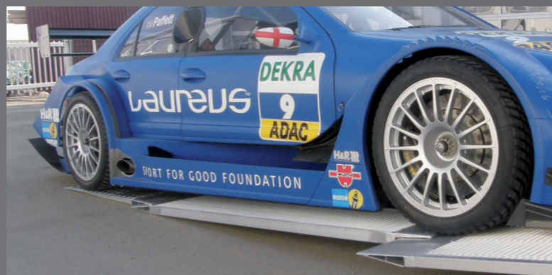
FGS-laadsystemen® Voor ieder laadprobleem de juiste oplossing