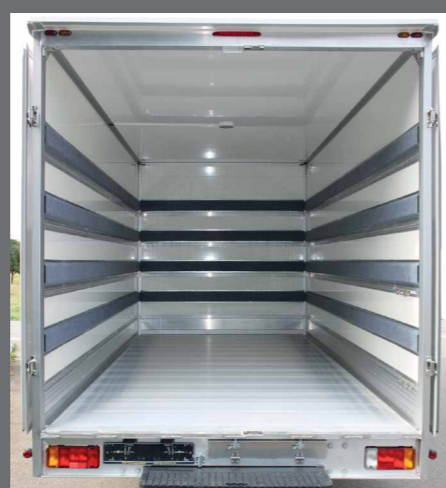
Geen wielkasten – efficiënte laadruimte