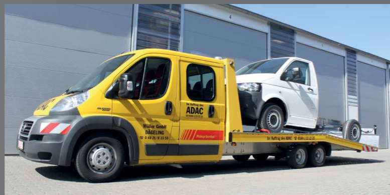
FGS Tow & Trans® Alles op het gebied van autotransport