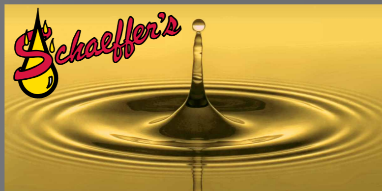
FGS smeermiddelen® Zoals de slogan van Schaefferoil luidt: Good People – Great Products