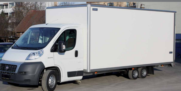
FGS chassistechniek® Ideale Rollin-Rollout concepten