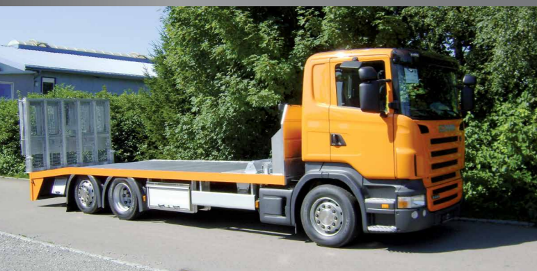
FGS Heavy-Duty plateaus® Laag eigen gewicht, veel netto laadvermogen