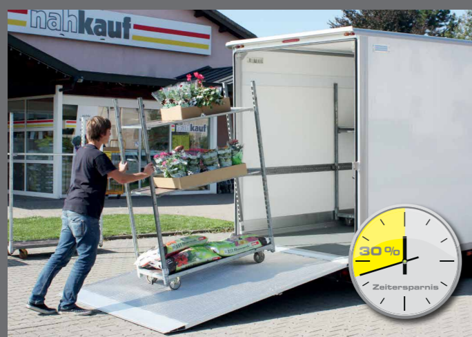
Snel laden en lossen, ca. 30% tijdsbesparing