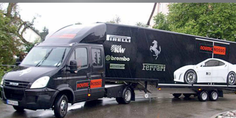
FGS Show & Event® Als het bijzonder moet zijn