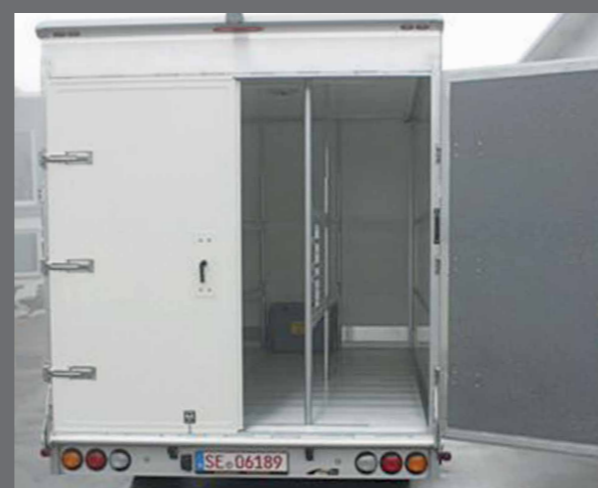
Overrijdbare, veerontlaste laadklep, ook als vast portaal met dubbele deuren leverbaar